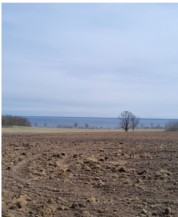
Jordbruksmark får tas i anspråk för bebyggelse om det behövs för att tillgodose väsentliga samhällsintressen. Bilden visar jordbruksmark inom Spakås.

Hjo kommun ska uppmuntra utveckling och byggande av bostäder som möjliggör att kommunen växer med 50 personer per år, men med en beredskap för 100 personer per år. Det ska finnas en god variation av boendeformer avseende både storlek och upplåtelseform. Befolkningsprognosen för Hjo kommun visar att antalet människor som är äldre än 80 år kommer att öka. Hjo kommun ska därför möjliggöra byggnation av fler anpassade bostäder med närhet till service och kommunikationer.