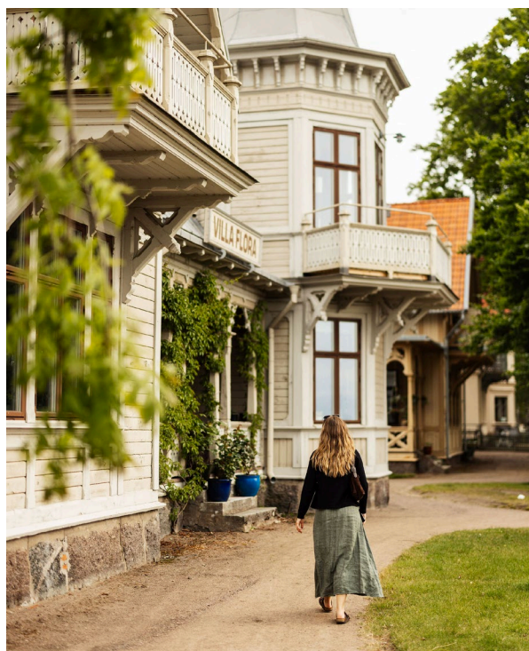
Hjo stadskärna ska behålla sin nuvarande utformning och karaktär. Bilden visar Villa Flora, en av stadsparksvillorna som ingår i stadsparkens byggnadsminne.

vis service, cykelväg, kollektivtrafikplats eller samåkningsparkering. Bostäder som skapar variation i bostadsutbudet bedöms också utgöra ett väsentligt samhällsintresse.