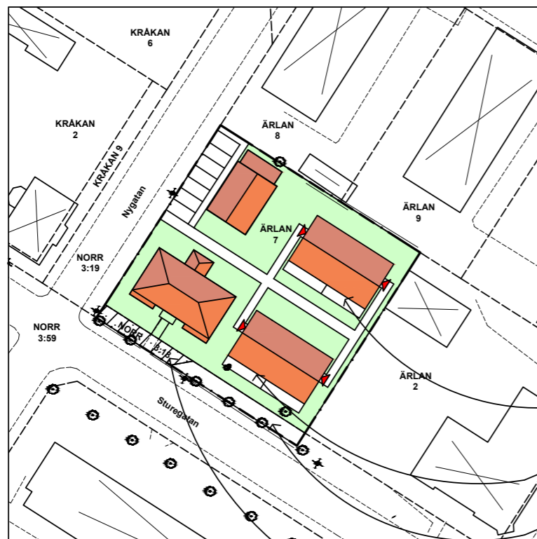
ILLUSTRATION, SKALA 1:500 (A1), 1:1000 (A3)

Genomförandetiden är 5 år från den dagen planen vunnit laga kraft.