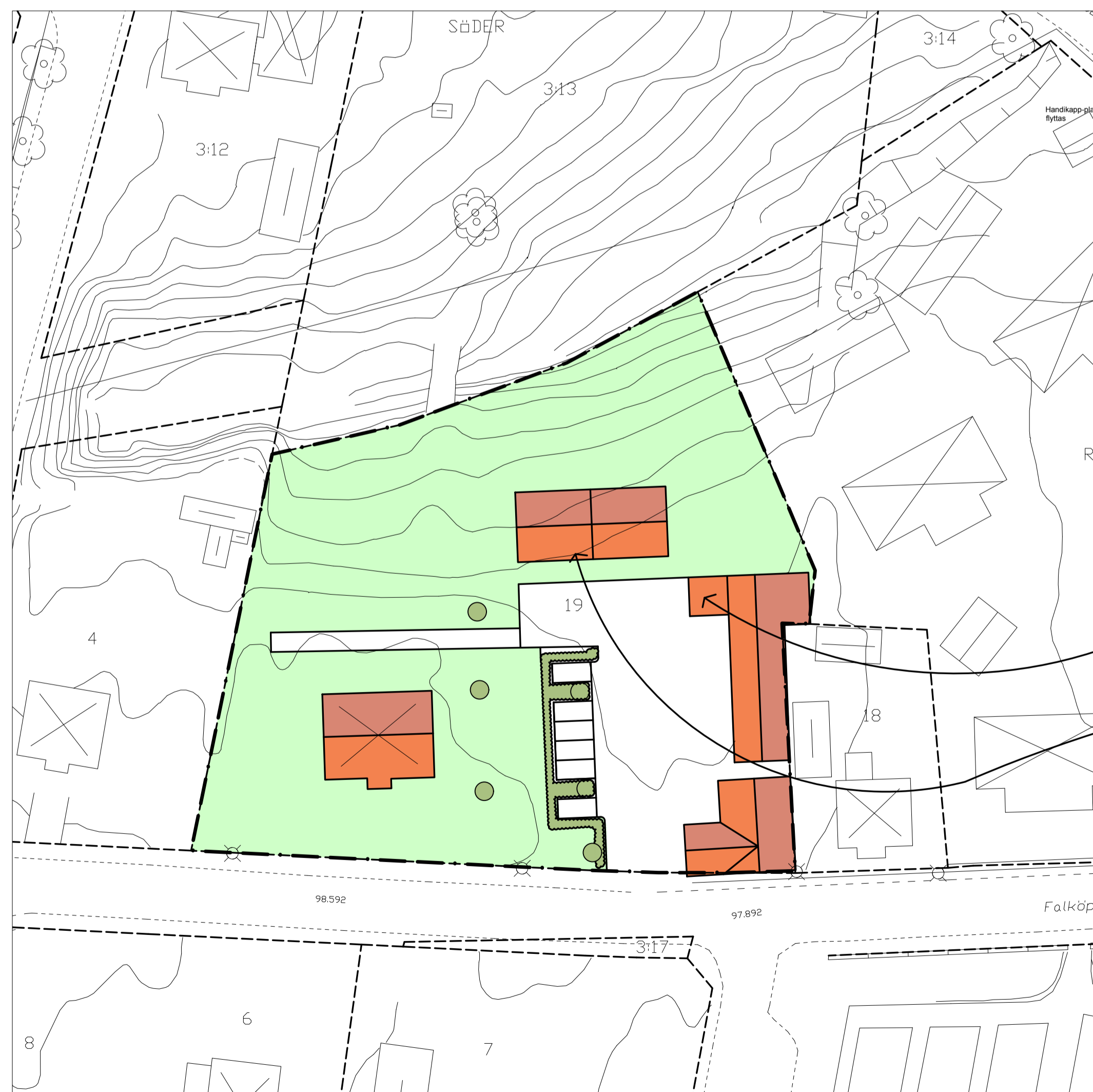
ILLUSTRATION, SKALA 1:500 (A1), 1:1000 (A3)