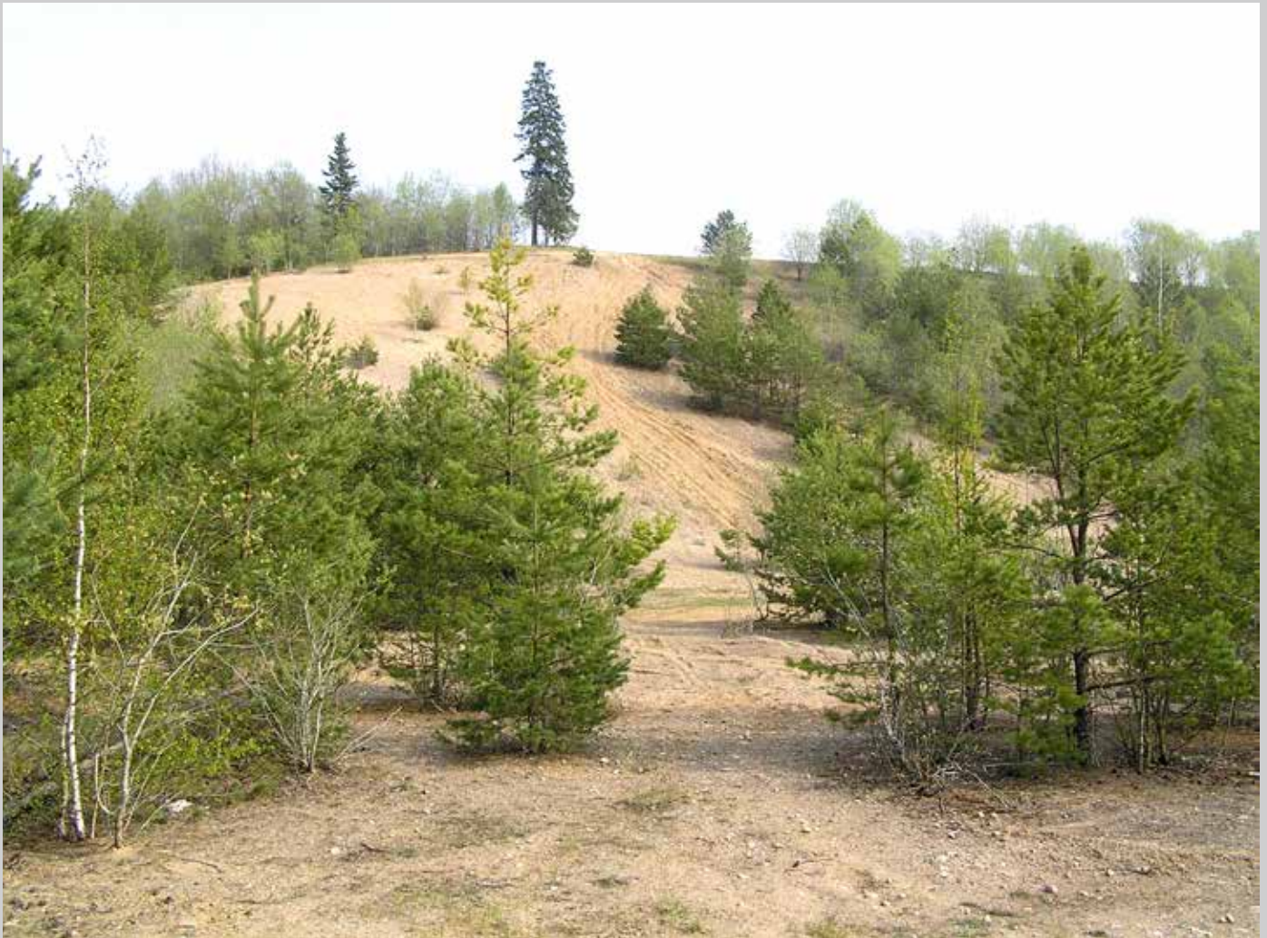
Grus- och sandtäckter är en viktig livsmiljö för vildbin. Här kan de finna både sandmark för bobygge och blommor för samling av nektar och pollen.