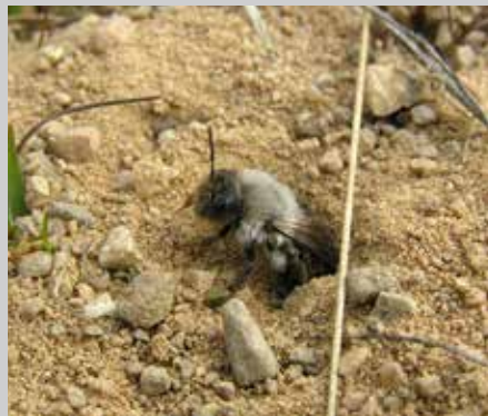
Sälgsandbi samlar endast pollen från sälg och viden.