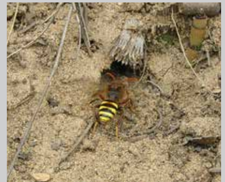
Sälggökbi samlar inte pollen själv, utan snyltar från sälgsandbi.