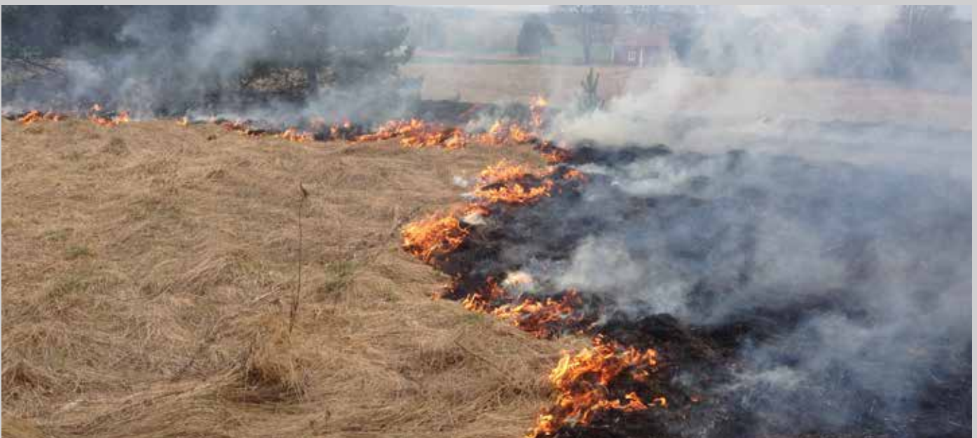
Genom bränning av gräs på våren kan man få bort fjolårsvegetation och dött organiskt material som ansamlats på marken. På så sätt ges ängsväxter en chans att stå emot högvuxna gräs och örter. Samtidigt skapas mer eller mindre blottad mark där vildbin kan gräva sina bon.