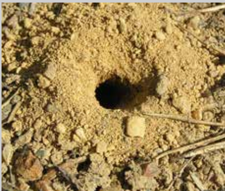
Sälgsandbi är ett av många vildbin som bygger sitt bo i sandmark.