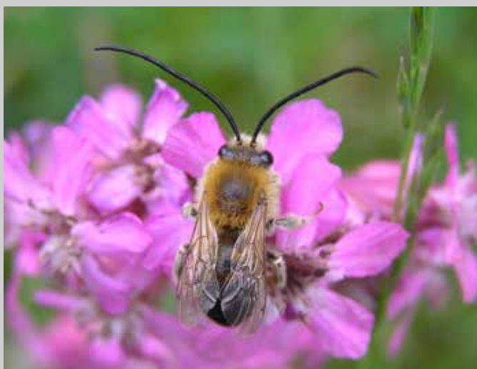
Länghornsbi är specialiserad på att samla pollen från ärtväxter. Hanan är lätt att känna igen på de långa antennerna.

Bina behöver tillräckligt med blommande pollenväxter inom flygavstånd från boet för att honan ska kunna livnära sin avkomma. Det måste också finnas växter som förser de vuxna bina med nektar, vilket fungerar som "flygbränsle". Ungefär en fjärdedel av de svenska solitärbin samlar endast pollen från en eller fåtal växter. Denna specialisering gör dem mycket effektiva i sin pollensamling, men samtidigt känsliga för störningar och variation i blomtillgång. Många av de utrotningshotade arterna är sådana specialister.