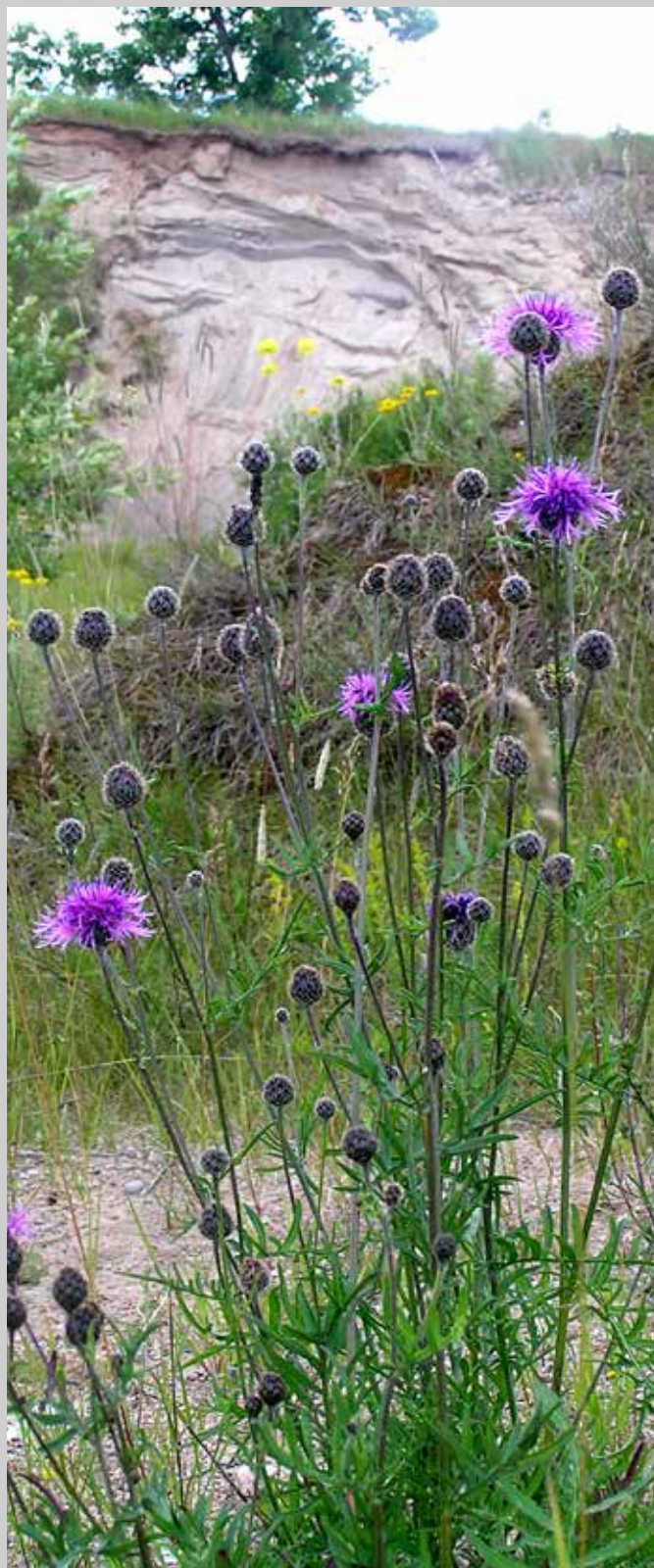
Väddklint utgör födokälla för en stor mångfald av blombesökande insekter. I bakgrunden en sydvänd sandskärning som fungerar som boplats för många vildbin.